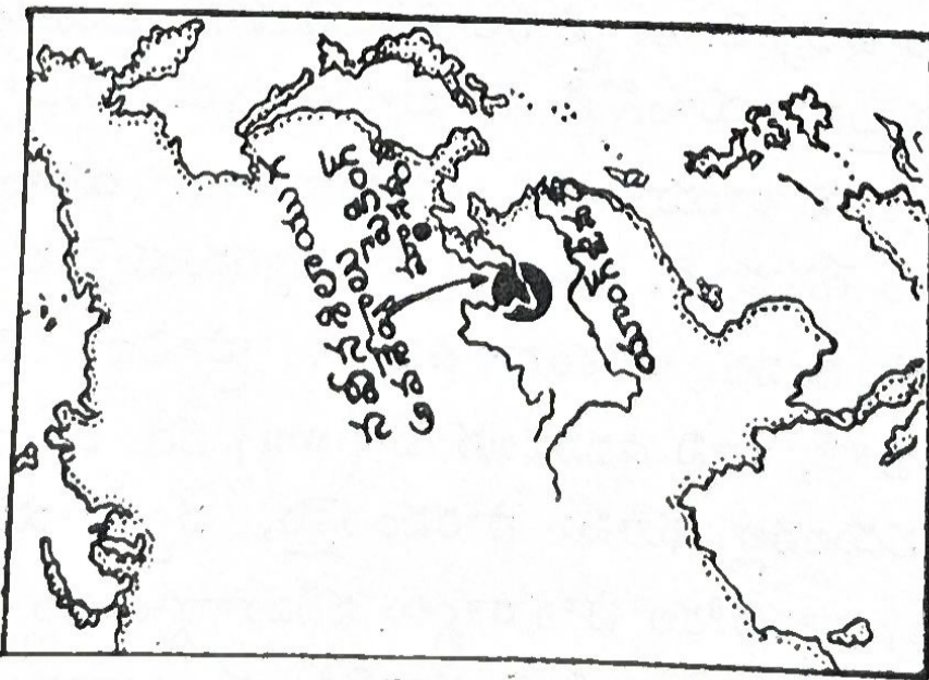
చరిత్ర పూర్వ యుగం చైనా