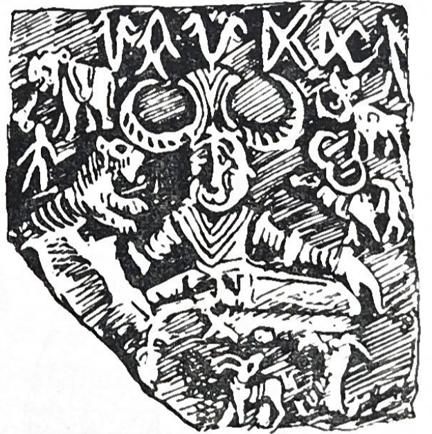
చిత్రపటము 12. మొహెంజోదారో ముద్రలు

సింధు ప్రజలు మృతదేహాలను ఖననంచేసేవారు. మొహెంజో దారోలో మూడు ఖనన విధానాలు కనబడినాయి, మొదటిది శరీరాన్ని పూర్తిగా ఖననంచేయడం. రెండోది మృతదేహాన్ని మృగాలు, పక్షులు తినగా మిగిలిన శరీరభాగాన్ని ఖననంచేయడం. మూడోది మృతశరీరదహనం తరవాత అవశేషాలను ఖననంచేయడం. హరప్పా, మొహెంజోదారో సమాధులలో దొరికిన ఎముకలు, అస్థిపంజరాలు, శరీరాలతో పాతిపెట్టిన సామగ్రి, వీటివల్ల నాటి ఆచారాలు తెలుస్తున్నాయి.