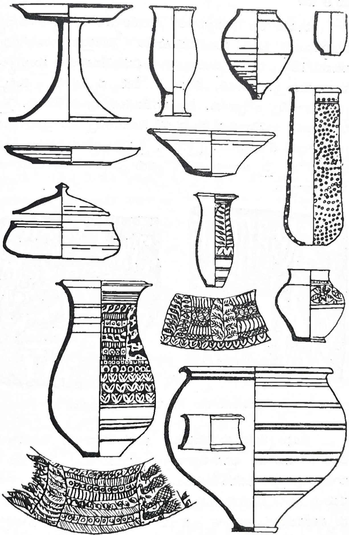
చిత్రపటము 11. హరప్పా మృణ్మయ సంపద